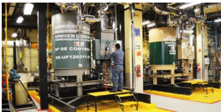
Instalaciones Múltiples de Generadores de Vapor Clayton en diversos Edificios de Máxima Importancia Empresarial y de manufactura de Sector Público y Privado.