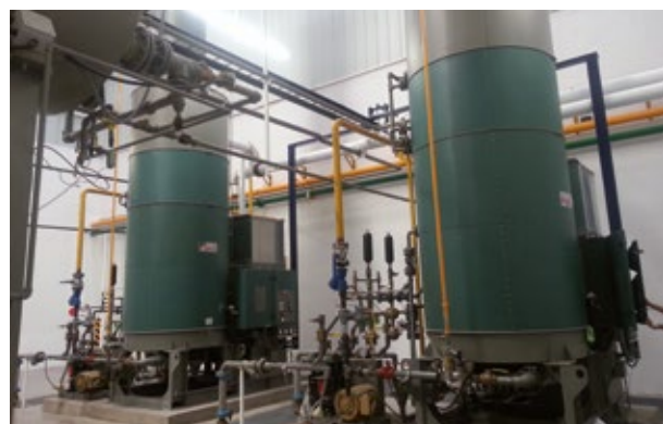
La Industria Nacional e Instituciones del Sector Gobierno reconocen la economía y Seguridad de los Generadores Clayton.

Clayton de México, S.A. de C.V. Planta Oficial y Matriz en México Manuel L. Stampa 54 Col. Nueva Industrial Vallejo 07700 México D.F. Tel. (55) 55865100 Fax: (55) 57471200 Larga distancia sin costo: 01-800-888-4422